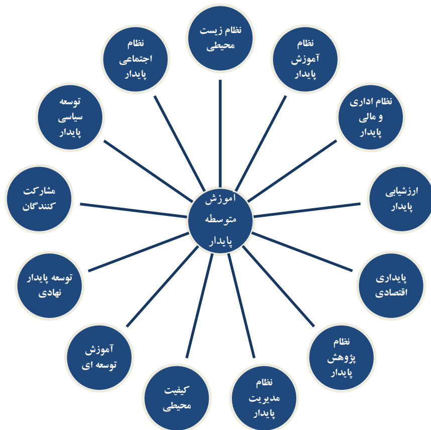
شکل ۱- نمایشی از ابعاد مدارس متوسطه پایدار

همان‌طور که در شکل شماره (۱) مشخص است از آن‌جا که مقوله‌های مزبور فراوان، مشابه و متداخل هستند، و در نهایت مقوله‌هایی گزینش شدند که از تمامی ۱۳ بعد، انتزاعی‌تر باشد. در همین راستا، برای تعیین مقوله‌ی هسته‌ای نهایی به یافته‌های پژوهش برگشته و به دنبال یافتن مضمون یا تم اصلی پژوهش، که در دل داده‌ها مکنون است، به بررسی مجدد و کنکاش در داده‌ها و یافته‌های کیفی پرداخته شد.